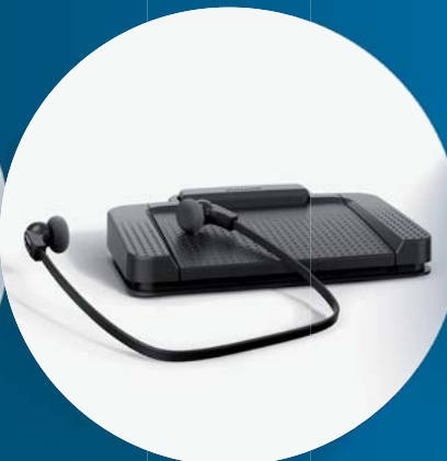
Der Schreibarbeitsplatz mit Fußschalter und Kopfhörer