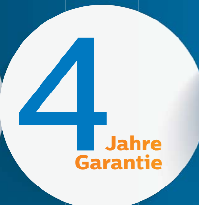
Das VIP-Service-Paket: Garantieverlängerung für Ihr Diktiergerät