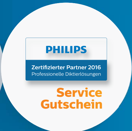
Einrichtungsgutschein. So binden Sie Ihren Kunden an sich