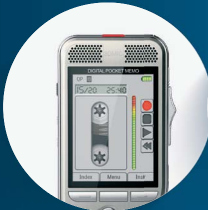
Das mobile Pocket Memo Diktiergerät mit unendlicher Kassette