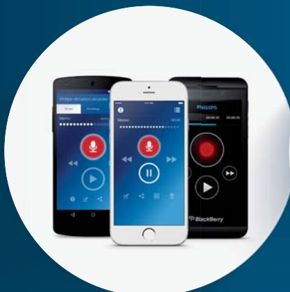
Die professionelle Diktier-App für das Smartphone: Sicher und verschlüsselt