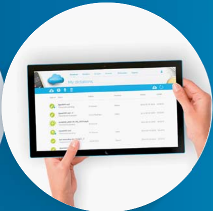
Ein Diktiersystem mit optionalem Schreibservice für 12 Monate